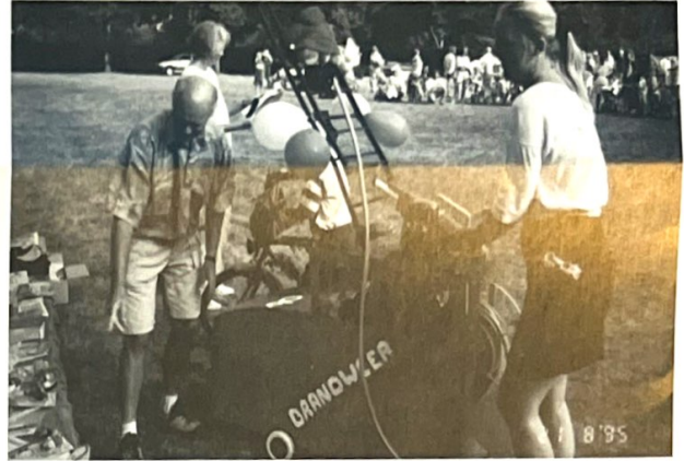
1 e prijs fietsjes/wagentjes

De kermisweek zit er weer op. Prachtig weer, vele activiteiten brachten veel mensen op de ben. De Oranje Vereniging kan dan ook op een zeer geslaagde week terugzien.