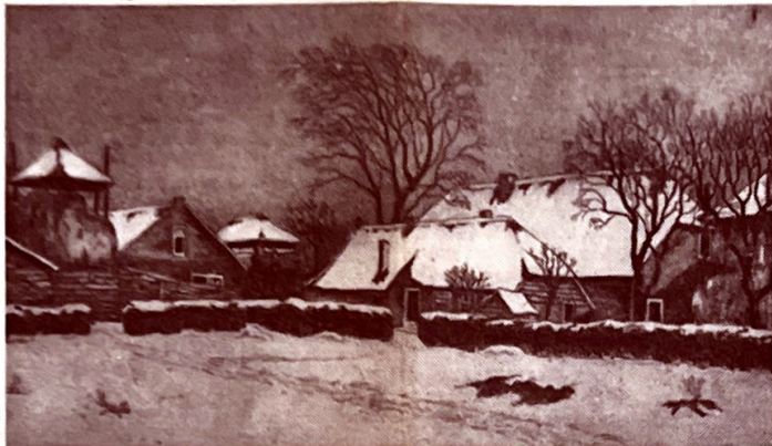
Winterstemming - Blaricum

Alles is daar even onecht. Steun daarom de boeren in Blaricum en verzet u tot het uiterste. Laat niet toe dat projectontwikkelaars ons zo krachtig levende dorp te gronde richten. En laten de leden van de gemeenteraad schouder aan schouder staan, want eendracht leidt tot macht en verdeeldheid zal alleen maar de belagers van ons aller erfgoed meewarig doen glimlachen!