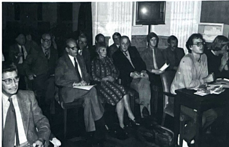
Centraal op deze foto leden van het Comité Blaricum Zelfstandig tijdens de hoorzitting grenswijziging Blaricum-Huizen. Zie pag. 4 voor een artikel van dit Comité en het IBBB over de gang van zaken.