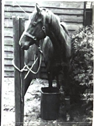
... in de soda