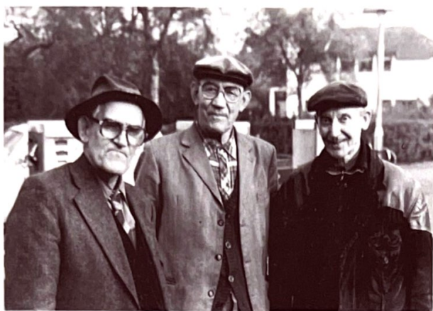
De drie broers