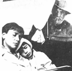
Scene uit 'Shishok de huisgeest', op 6 november om drie uur in de Blaercom.

De meeste kinderfilmhuizen in ons land, een stuk of 30 in totaal, zijn gevestigd in de grote plaatsen.