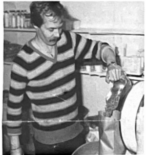
Een bezoek dubbel en dwars waard. Dagelijks (behalve op dinsdagmiddag) open, ook tussen de middag.

Verder treft u bij Grondelle hengelsportartikelen, tuinbenodigdheden en tuinzaden aan. Ook is op kleine schaal levende have aanwezig zoals vogels en koudwatervisjes. Alle artikelen staan keurig en overzichtelijk in de grote winkel. Een heerlijke zaak om te kopen en ideeën op te doen voor een (nog) betere verzorging van uw huisdier of uw tuin.