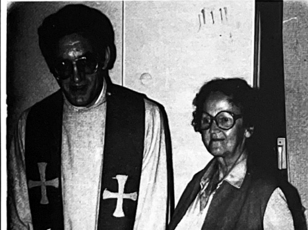
Heer zijn. Ik geloof dat we allemaal wel onder de indruk van dit misoffer waren.