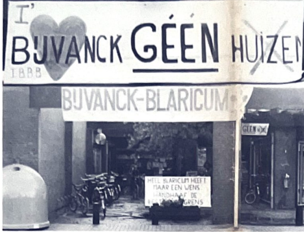
Uit de, bij winkelcentrum 'De Balken', geplaatste leuzen blijkt dat Bijvanck bewoners niet gelukkig zijn met de beslissing van de minister.