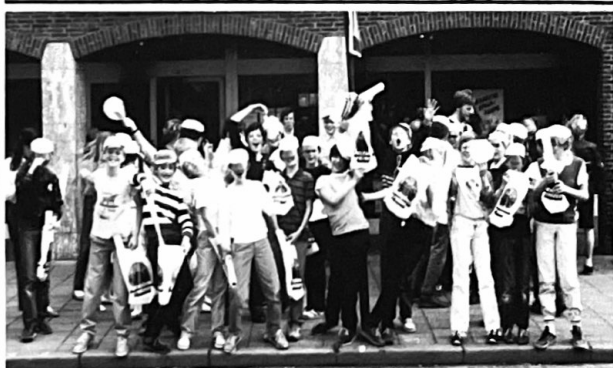
Na het succes van het vorig jaar heeft de Rabobank wederom rondleidingen voor de hoogste klassen van de Blaricumse basisscholen georganiseerd. In zes ploegen hebben 320 kinderen de bank bezocht om eens een kijkje achter de schermen te kunnen nemen. Zowel kinderen als begeleiders waren zeer enthousiast en vonden het erg leerzaam. Op de foto het vertrek van een groep kinderen.