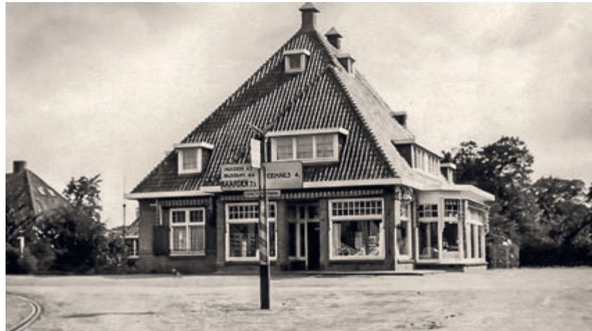
Huizerweg 2 in 1934