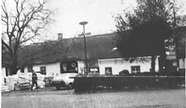
boerderij aan de Meentweg

Andere zien geen noodzaak een misschien nog goed werkend nuttenstelsel te vervangen