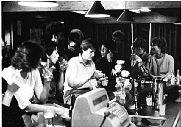
Na afloop van een bijeenkomst gezellig nog wat napraten aan de bar in De Malbak.

Onder grote hilariteit worden andere ballen geraakt en van hun plaats geroofd. De kunst is dus, om de bal het juiste effect te geven zodat hij, ondanks de afwijking, toch naar de goede plaats rolt. Momenteel bestaat de groep uit ongeveer 12 dames. Er kunnen echter meer mensen aan mee doen. Dat maakt het spel alleen maar leuker. Vandaar hierbij een oproep aan dames,