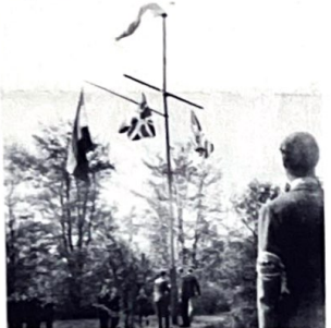
De twee Canadese onderduikers hijsen hier de Engelse vlag

In de Laarder Courant 'de Bel' hebt u al een foto kunnen zien, die ter beschikking aan de Historische Kring van Eemnes is gesteld, maar zeker ook een plaats in de Hei & Wei verdient. Mevrouw Sieke Broekema-Kruize, eens een van de vier kinderen die in dat huis woonden, stelde deze en ook de bijgaande foto's ter beschikking en vertelde, eveneens zeer bescheiden, over de jaren veertig-vijf en veertig, toen dat huis een centrum was van het ondergrondse verzet tegen de vijand en de onderdrukking van die jaren.