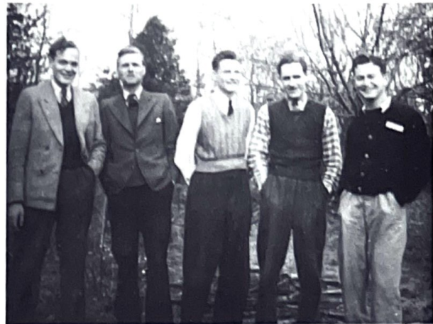
5 gealleerde, ondergedoken piloten. De twee links zijn de Canadezen, de drie rechts de Amerikanen

Twee joodse meisjes bleven tot het eind van de oorlog, één ervan trouwde met de zoon des