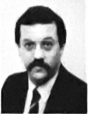
De afbeelding toont een man met een mustache, mogelijk een lid van de lokale verenigingen.

De gemeente heeft een nieuw gezicht. Het gezicht wordt verzorgd door de lokale verenigingen. Het programma omvat diverse optredens, wedstrijden en feesten. De festiviteiten worden gehouden op zaterdag 15 april (Koninginnedag) en zondag 16 april (Bevrijdingsdag). De activiteiten worden gehouden op zaterdag 15 april (Koninginnedag) en zondag 16 april (Bevrijdingsdag).