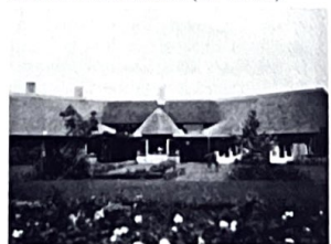
De Aagieshoeve in volle glorie

Blaricum had aan het begin van de oorlog niet meer dan 3924 inwoners (nu: 11.304).