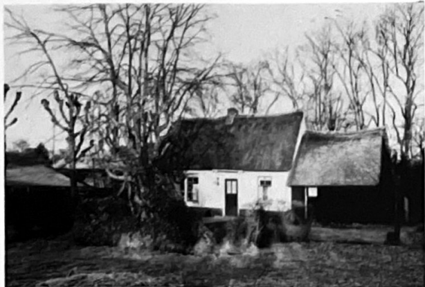
Stuur ook eens 'n Blaricumse foto in voor Hei & Wei