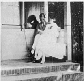
'Ik zal de halmen niet meer zien nog binden ooit de volle schoven, maar doe mij in den oogst geloven waarvoor ik dien..... (Uit 'De Ploeger', A. Roland Holst.)