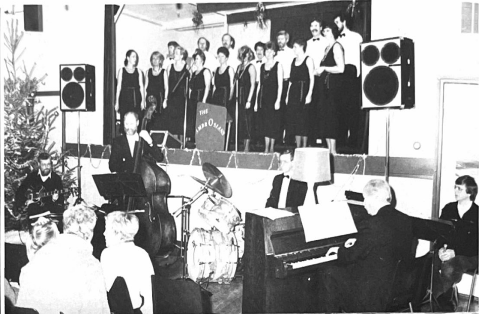
The Ambrosians in actie tijdens het kerstconcert voor het Katholiek Vrouwengilde in Blaricum.