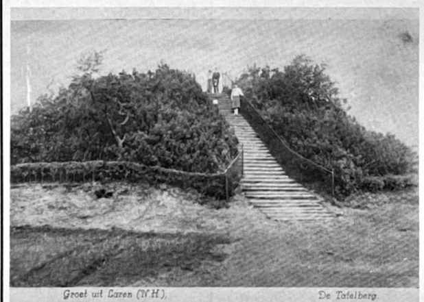
Groot uit Laren (N.H.)