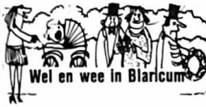
Wel en wee in Blaricum