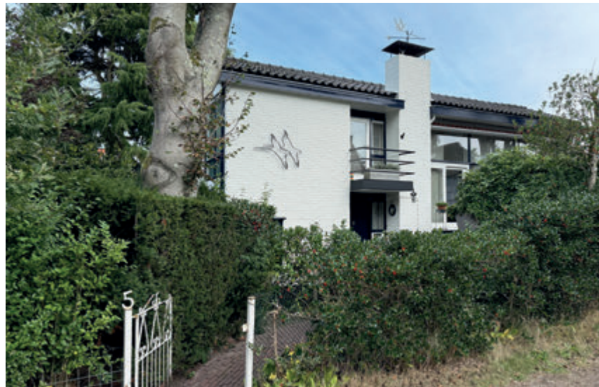
Tweede Molenweg 5, het Huis van Koen

Het huis op de hoek van de Tweede Molenweg en Capittenweg, Tweede Molenweg 5, is in de Blaricumse volksmond ook wel bekend als het Huis van Koen. Het huis van Tanja en Peter Koen.