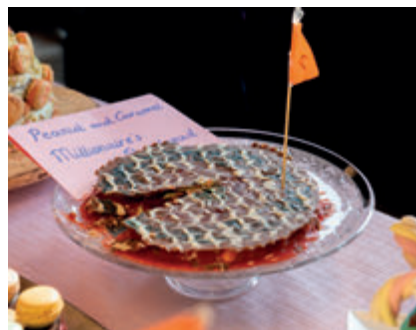
Millionaires Caramel Shortbread van Babette