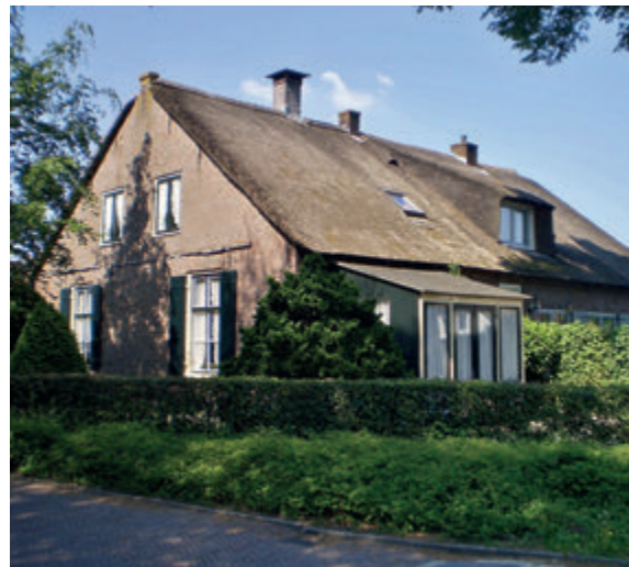
Eemnesserweg 10 met een aangebouwde houten erker om zomergasten te kunnen ontvangen

een nieuw fenomeen: zomergasten. Veel Blaricumse boeren lieten hun vee 's zomers buiten lopen, gingen zelf op de deel wonen en verhuurden het voorhuis van hun boerderij dan aan Amsterdammers. Gezinnen keerden vaak jarenlang terug naar hetzelfde adres. De mannen gingen na hun twee weken vakantie pendelen naar Amsterdam, terwijl hun vrouwen met de kinderen in Blaricum bleven. Bij sommige boerderijen werd zelfs een houten erker aangebouwd om meer ruimte te creëren. Deze zomerse verblijven leidden tot langdurige vriendschappen en zelfs huwelijken. Zo bleef de band tussen Amsterdam en Blaricum door de eeuwen heen stevig.