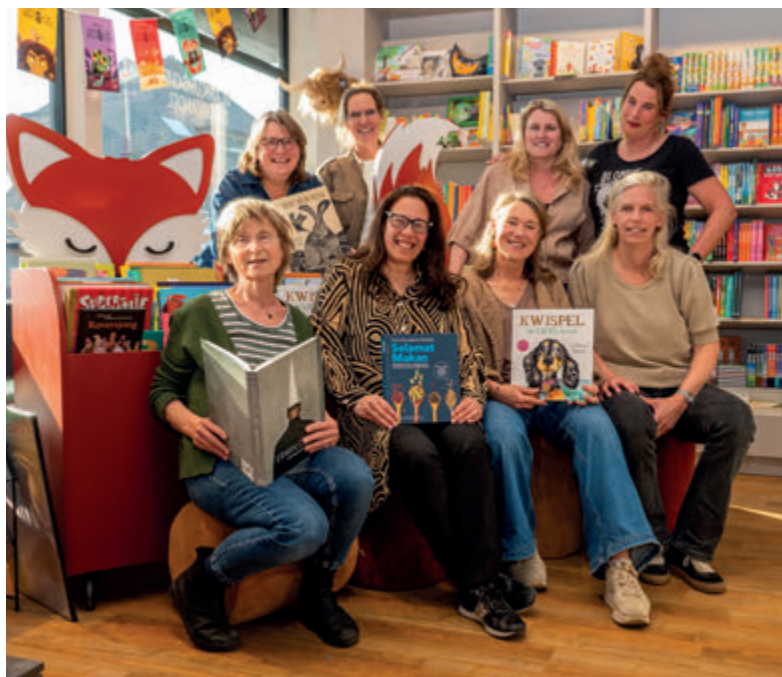
Het team van de boekhandel

cadeautje of gewoon om rond te kijken. Ook voor ontmoeting is er ruimte. De winkel vormt het decor voor kleinschalige bijeenkomsten zoals lezingen, interviews en signeersessies.