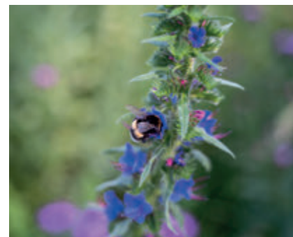
Bloemenweelde in juni

tief biodiversiteitsbeheer: verschrallen (maaisel afvoeren), gefaseerd maaien, geen bemesting en ruimte geven aan spontane flora, waardoor een stabielere biodiversiteit ontstaat. Aan de gemeente Blaricum de schone taak om deze zaken in de gaten te houden. Genoeg te genieten in Blaricum Buiten!