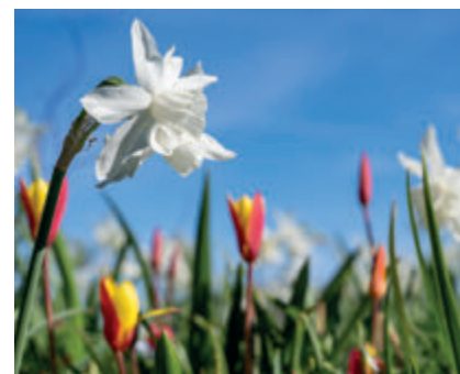
Bloemenpracht in april/mei

Ecologen noemen als positieve aspecten van het Bonte Berm-concept: meer bloemen dan alleen gras, een lange bloeihoog, minder maaien en meer bewustwording over biodiversiteit. Aandachtspunten zijn er ook: soms wordt onvoldoende gebruikgemaakt van zaden en bollen uit de eigen regio en is er in het eerste jaar een spectaculaire bloei van kortlevende pioniers, met het risico dat die na één à twee jaar verdwijnen, waarna het systeem weer grasrijk en soortenarm wordt. Belangrijk is effec-