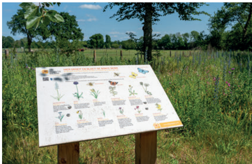
Bonte Berm Meentzoom